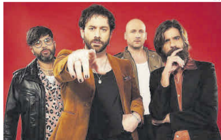
La banda murciana Viva Suecia.

Pero las ganas de disfrutar del directo «único y exclusivo» de Viva